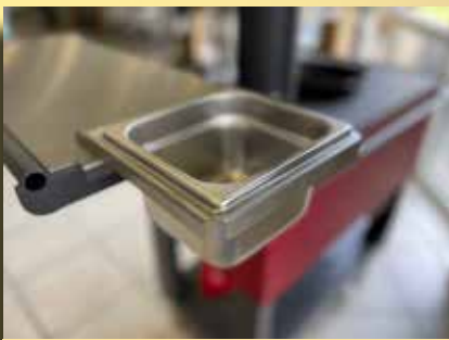
Einhängerahmen mit GN Gefäß